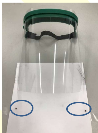
Figura 1. Ejemplo de las ligeras marcas del impacto sobre el folio blanco a través del papel de calco en los casos en que se produce marca, aunque no deformación remanente.