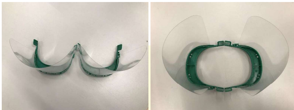
Figura 2. Pantallas faciales, izquierda antes del ensayo y derecha tras ensayo de estabilidad al calor.

No se observan deformaciones, defectos o pérdida de funcionalidad tras el ensayo.